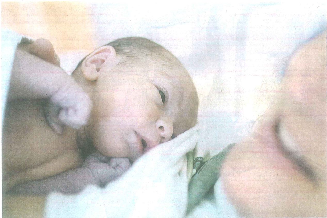
Neugeborenes: «Spontangeburt sind zu tief tarifiert», sagt der Direktor der Klinik für Geburtshilfe am Uni-Spital Zürich