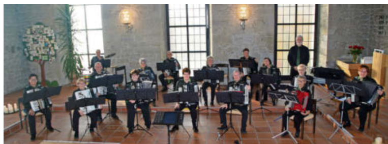
Das Akkordeon-Orchester Grüningen tritt am 26. November in der Schlosskirche auf.